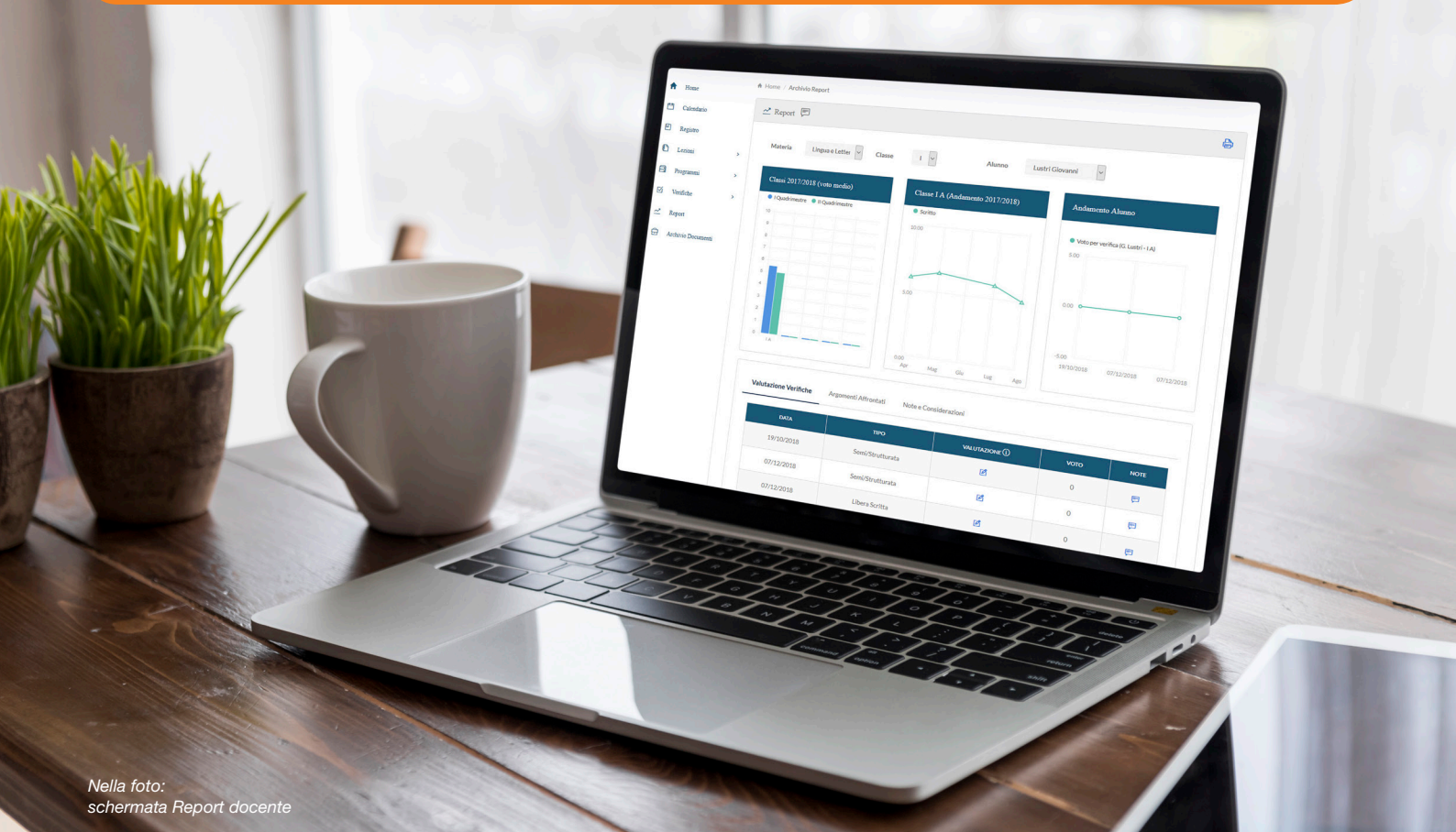
Nella foto: schermata Report docente

Tutti gli utenti, indipendentemente dal loro ruolo (scuola, docente o studente), possono accedere alla piattaforma Didalo via browser utilizzando qualsiasi tipo di device , sia esso un PC con sistema operativo desktop (Windows, MacOS, Linux, Chrome OS) o un tablet con sistema operativo mobile (iOS, Android).